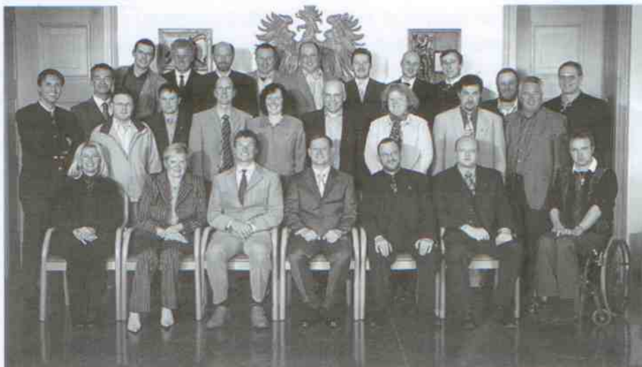
Die Mittersiller Gemeindevertretung nach der Wahl 2004

Die Liste der wahlwerbenden Parteien und die Wahlvorschläge für die Mitglieder der Gemeindevertretung bzw. des Bürgermeisters sind auf den folgenden Seiten kundgemacht.